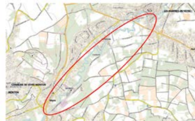
Situation du projet