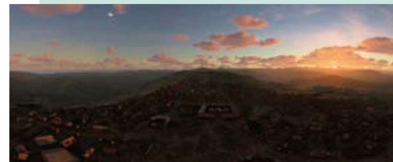
Vue 3D de l'oppidum de Corent.